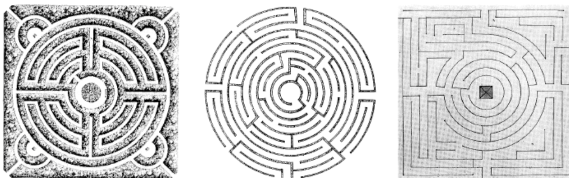
Abb. 1: Festgelegte Darbietungssequenz mittels eines Anstiegs des Komplexitätsgrades der Labyrinthaufgaben von links (Labyrinth 1), über das mittlere (Labyrinth 2) bis zum rechten Labyrinth (Labyrinth 3)

In Bezug auf das visuelle Stimulusmaterial wurden drei unterschiedlich komplexe Labyrinthaufgaben verwendet. Die Bestimmung des Komplexitätsgrades erfolgte über (1) die Anzahl der Eingänge, (2) die Anzahl der zielführenden Eingänge, (3) den kürzesten Idealweg zum Ziel und (4) die Wegabweichungen vom kürzesten Idealweg. Demnach mussten die Labyrinthaufgaben folgende Bedingungen erfüllen: Sie müssen über mehrere Eingänge verfügen, welche über verschiedene Wege zum Zentrum – dem Ziel der Labyrinthaufgabe – führen und auch Sackgassen beinhalten können. Beim Bildmaterial handelt es sich um Labyrinthentwürfe von verschiedenen Künstlern des 17. und 18. Jahrhunderts. Die festgelegte Darbietungsfolge der Labyrinthaufgaben geht mit einer jeweiligen Steigerung des Komplexitätsgrades einher (vgl. Abbildung 1). Das erste Labyrinth stammt von Jean Francois de Neufforge: „ Kupferstich mit sechs Grundrissen für Garten-Labyrinth “; das zweite Labyrinth ist von Petrus Laurembergius: „ Horticultura “ und das dritte von Ignaz Haas: „ Entwürfe für Gartenlabyrinth “.